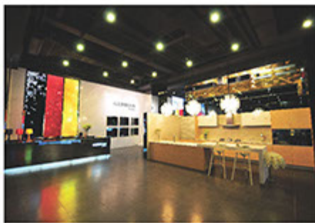
■ 德國寶國內整體廚房旗艦店