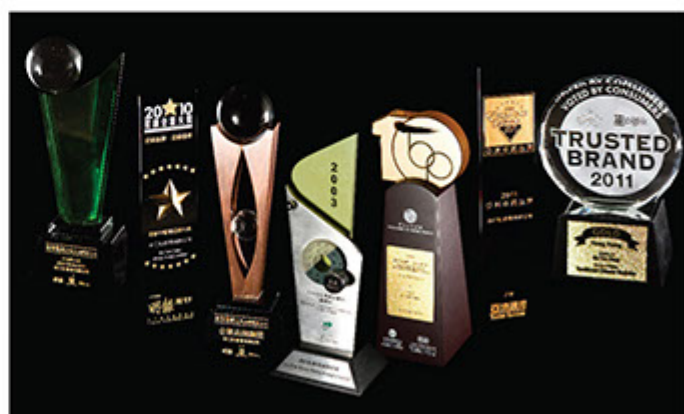
■ 余仁生多年來的品牌改革成功，產品服務質素皆獲得各界肯定，屢獲殊榮