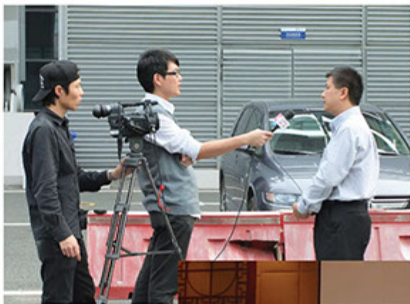
■ 深圳衛視於深圳會展中心，專題採訪

【富藤】一直於不斷引進先進科技加入創新環保節能概念，增強競爭能力，每年更設定不同環保節能口號。2009年環保展以「一個太陽、四個天使、守護地球」作標題、2010年以「【富藤】成功為地球減少超過一百萬噸二氧化碳」、2011年以「地球是我家、環保靠大家」，以配合產品之推廣並讓品牌深入人心。為迎合市場未來發展及強化競爭力，【富藤】除與香港理工大學共同擴建環保領域外，更引進各國環保企業新一代環保產品如：海浪發電系統、生物柴油及太陽能多方位應用等項目與時並進。一個品牌的誕生是綜合品牌的經營、策劃、定位及管理。【富藤】希望透過品牌效應創見未來擴展經營領域，提升品牌核心價值，為未來香港新動力作出供獻。