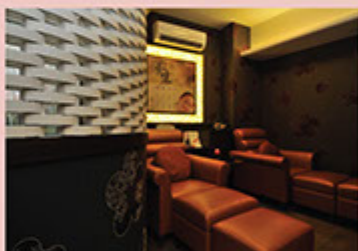
廣東道總店擴充，增設「中西養生SPA」