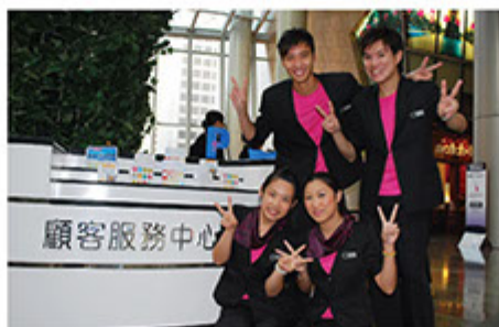
■ 成立「顧客服務大使」團隊，照顧商場遊客的各種需要

公司非常關注商場內特別人士的需要，特別訂了《協助有需要人士》工作指引，透過培訓鼓勵員工在工作中主動及積極向年老長者、傷健等人士提供體貼的協助。