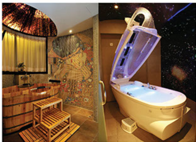
■ 設有「中西養生Spa」，提供多項養生保健美療，平衡調理，達到由內至外的健康美。

艾卡美非常重視每一位員工的個人成長、事業與家庭的健康發展，為員工提供一連串系統式的專業培訓，包括：理論、知識、手法、技巧，以及情緒管理、人際關係、溝通及客戶服務，透過不斷的學習來提升自我，員工並可通過考核及評估進升。自2011年起，艾卡美亦有參與erb僱員再培訓局、浸信會愛群社會服務處等合作的招聘計劃；並用心培訓年輕新血，欣賞年輕人有活力、富創意，而在艾卡美所培訓出的美容師，不但成為專業認可的技術人員，對他們在行內繼續發展有莫大裨益。