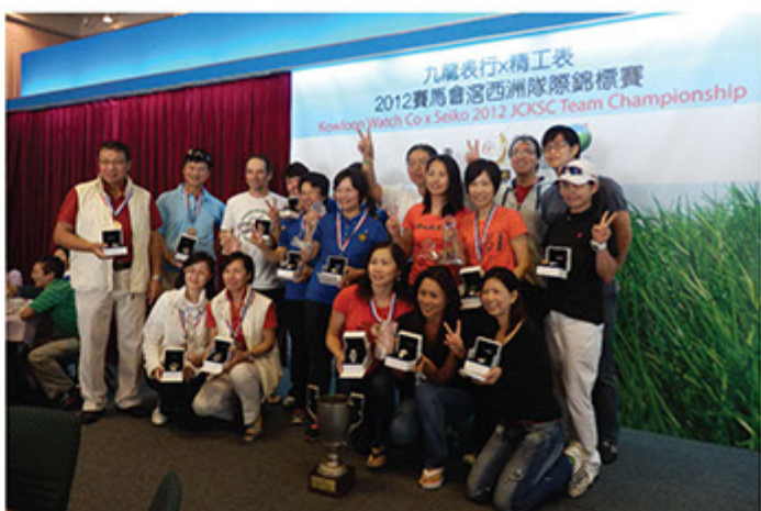
■ 九龍表行X精工表贊助高爾夫球比賽