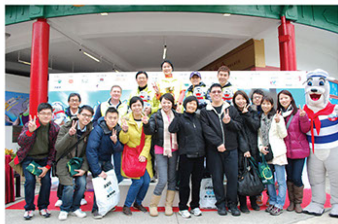
■ 成立「義工服務隊」，自2008年起為社會人士提供多元化義工服務

展望未來，我們會堅持以「乃役於人」的服務精神，在執行日常物業管理的工作的同時，努力為顧客，租戶提供最優質的服務質素，在環境保護及社會關愛方面，會繼續努力，為香港服務業界提升國際形象，亦冀望能為祖國顧客服務領域上，作出一點貢獻。