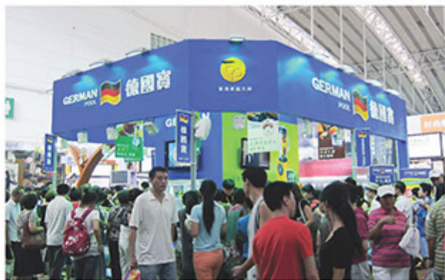
■ 德國寶積極參與國內大型展會，拓展業務

獨特，整個抽氣扇包括摩打、扇葉、面罩、鎖帽、百頁等均可拆下清洗，損壞零件可以逐件更換，不需要因部份零件壞掉而要整個換掉，既慳錢又環保；而氣體煮食爐，配有創新一按式打火設計，避免浪費燃氣，既節省能源又可享受更清新家居環境；德國寶的太陽能熱水系統，能利用吸熱板吸收太陽能將來水加熱，提供免費熱水供應。德國寶儲水式電熱水器，氣體熱水器、雪櫃、洗衣機等，均獲發一級能源標籤有效節省能源。