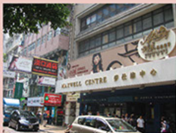
漢口道(分店) 「艾卡美科技美容中心」啟業