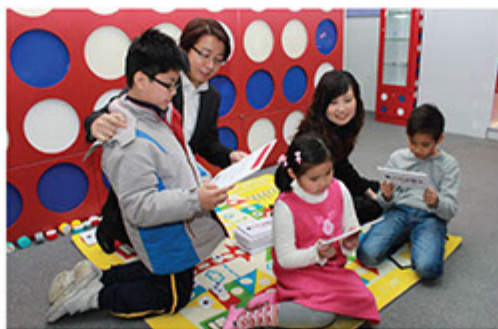
「現代小學士」為小學學生提供不同種類課程，為學生將來打好基礎

另外，我們已成功打入內地市場。集團透過多個策略性夥伴與內地著名中學及幼兒園合作，為內地學生提供英語培訓及以英文作為教學語言的預備課程。既迎合現時內地對雙語幼兒教育的熱切需求，更有助鞏固及開拓內地一二線城市的龐大市場。