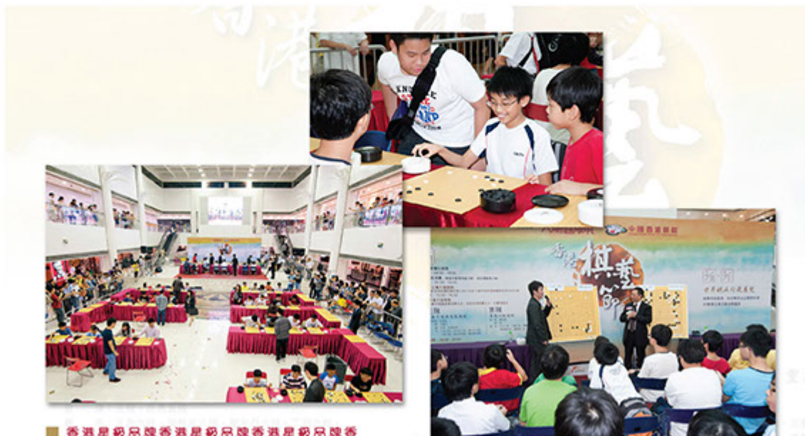
■ 香港星級品牌香港星級品牌香港星級品牌香

中國香港棋院於2007年成立，前後邀請到多位本港和國內棋藝冠軍加盟導師行列，更在短短五年間，開拓至港九新界六間分院，學生人數不斷增長。對於師資的培訓，我們提供每星期一次的工作坊和交流會，讓不同年資的導師交流教學心得和切磋棋藝，同時每年舉辦大型學界棋藝賽事「小棋聖盃」讓香港棋手能大顯身手，以及邀請國內知名世界冠軍棋手古力等到港交流，加強導師棋力和眼界之餘，更增長學生作賽經驗。此外，棋院更有完善的晉升制度，根據導師的賽事成績和教學年資每年評核，棋院更支持導師參與本港及海外，例如世界智力運動會和亞運會等大型賽事，為港爭光。