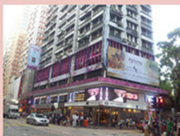
廣東道(總店) 「艾卡美減肥美容中心」啟業