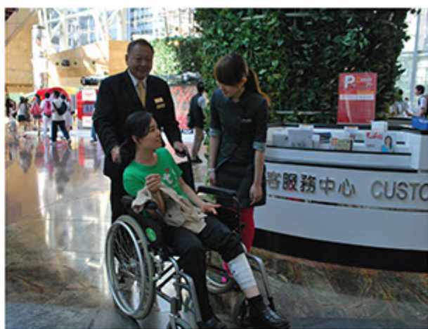
■ 鼓勵員工在工作中主動向年老長者、傷健人士提供體貼協助

於2006年，同事們自發成立義工服務隊，與管理層積極參與多項義工活動，以愛心關懷社會的弱勢社群。此外，公司亦與多個團體合作籌劃多項慈善、賑災籌款及藝術文化活動，讓同學及市民大眾營造一個彼此關愛、祥和合作的社會氣氛。