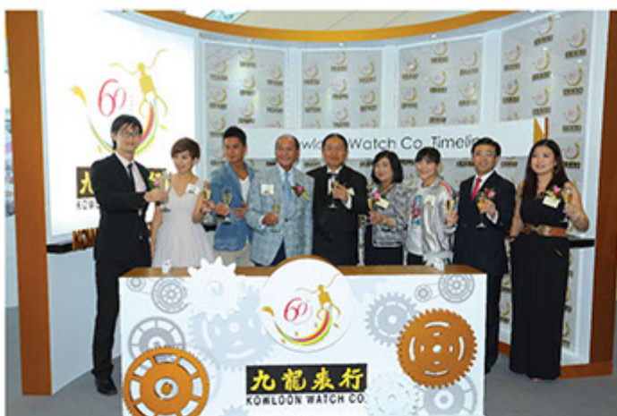
■ 九龍表行六十周年巡迴展開幕典禮