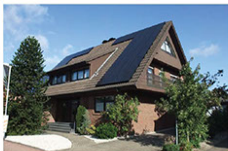
■ 太陽能屋頂在歐、美、日及澳洲都十分流行

【富藤】作為一家國際綜合性高科技環保企業，從2000年在香港成立以來不斷發展高科技環保節能產品技術，到2004年配合節能減排的需要引進日本一系列環保產品。並於2005年洞釋到內地市場龐大及客戶集中等優勢，開展大中華節能概念進軍國內市場，為香港踏入知識型經濟北上發展再上臺階。現【富藤】成為今天香港環保界的前瞻企業，業務遍及東南亞，每年業務均有雙位增長，不斷為股東創造價值。