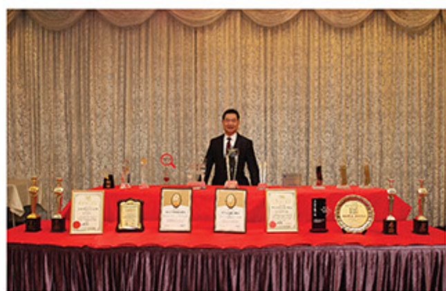
■ 煌府婚宴集團獲獎無數

集團持續發展的優勢，煌府集團近幾年已累積了一定的經驗和著名度，在婚嫁餐飲行業中不斷突破，企業品牌也家喻戶曉，現時擁有十二間大型的婚宴專門店，接近一千席的宴會場地，穩佔全港婚宴市場的龍頭地位，今年，煌府尖沙咀帝后廣場店及元朗店將於8月份開幕。尖沙咀九龍中心店將於11月登場。