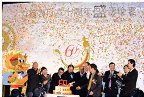
九龍表行六十周年盛傳晚宴

九龍表行相信人才是公司重要的資產，因此我們十分著重員工福利；每間分店都設有員工休息室及為每名員工設有私人儲物空間。我們亦將培育人才視為己任，每名前線員工入職時均需接受產品知識課程及優質顧客服務的訓練，務求令每名員工皆達到標準，為顧客提供最優質的服務。