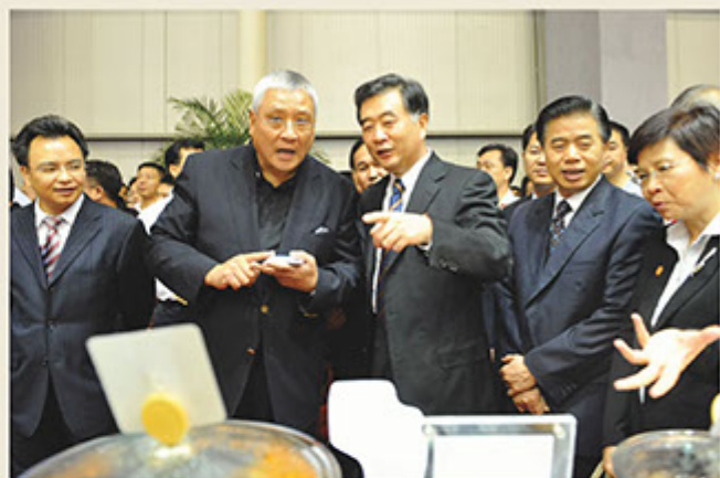
■ 國務院副總理汪洋參觀廣東外博會德國寶展位

此外，德國寶亦組織員工參與不同的義務及籌款工作，例如：每年為香港外展訓練學校籌款的衝勁樂、香港公益金百萬行等；並捐助獎學金予香港各大院校的學生。每年提供數十個實習名額予職訓局及不同學校的學生，祈望在不同的範疇，為社會作出貢獻。