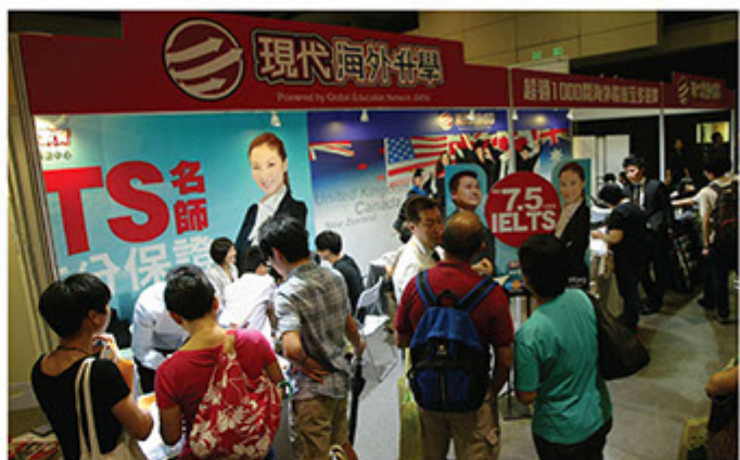
■「現代海外升學」擁有英、美、澳、加、紐超過1,000所海外大學網絡，為學生打造一條龍服務

受惠於補習業務的龐大學生群，令我們在海外升學業務方面，比坊間其他同類機構做得更出色。今年，我們增設海外大學先修班及文憑課程，讓學生在港修讀部份大學課程，及早完成夢想。學生可以受惠於更短的修讀時間和更低廉的學費，在本地修讀海外國際預科課程。學生成功畢業後，可選擇入讀美、加、英、澳、紐等地方超過1,000所海外大學，開展美好的前程。