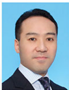
郭振邦博士 香港中小型企業聯合會 會長