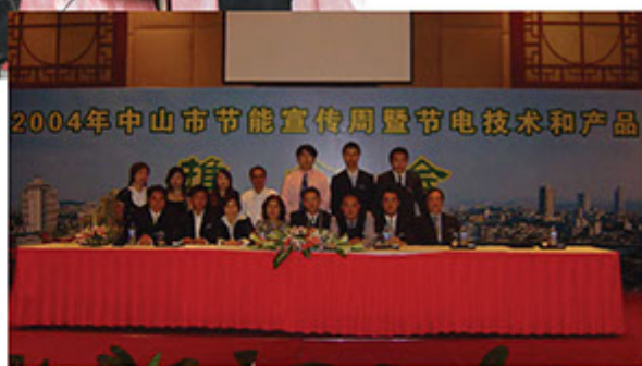
■ 富藤10年前已積極參與內地環保活動