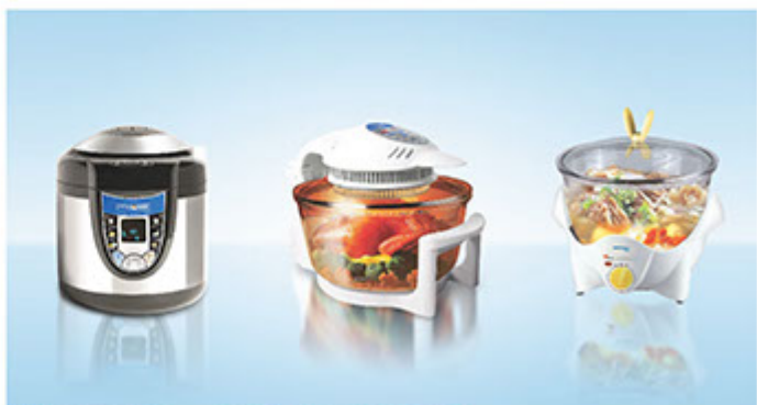
■ 時尚生活電器，掀起全城健康飲食新風潮