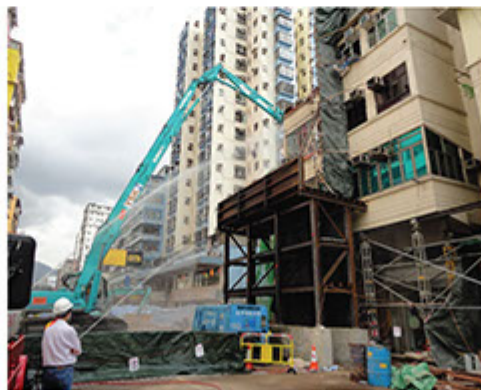
■ 新福港於2010年發生的馬頭圍道唐樓倒塌事件中，迅速地調配人力物力，協助屋宇署進行緊急的鞏固工程。