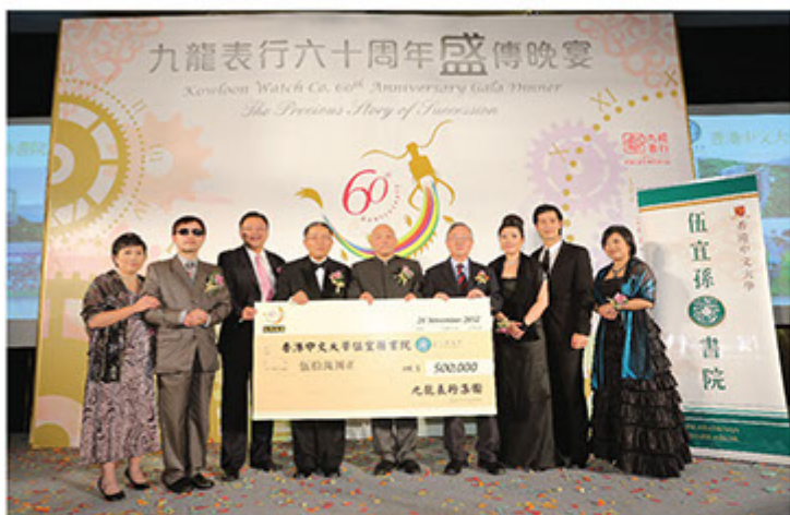
■ 支票捐贈予香港中文大學伍宜孫書院

我們尊重顧客利益。所以顧客在購買產品時，前線員工會向顧客清楚解釋售後服務，讓顧客明白自身權益。作為在香港紮根的企業，九龍表行相信年青人為社會未來棟樑，我們以公司作為社會平台，讓年青人加入公司，讓他們為未來黃金三十年努力奮鬥，爭取提升自己的生活質素。