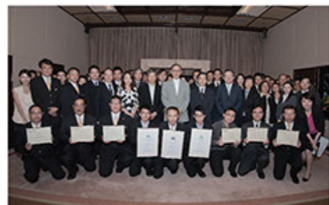
■ 集團主席嘉許表現優秀的前線員工，給予支持及鼓勵

我們深信，不斷進行檢討，才能使團隊持續進步。因此，我們定時進行神秘顧客計劃及顧客滿意調查，尋找日常運作中的不足之處，運用Corrective and Preventive Action Plan（CPAR）系統進行有效改善措施。