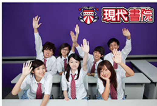
「現代書院」揀選經驗豐富的老師、建設優質的教學設備、制定完善的升學制度，全面提升學生學習效能