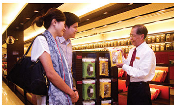
■ 余仁生的員工皆定期接受培訓，以提高專業中醫藥知識及服務質素。