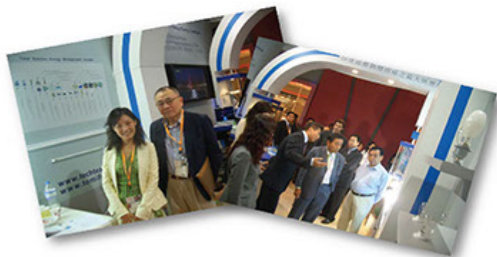
■ 富藤積極參與商界活動，提供環保訊息