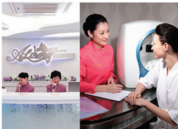
■ 憑著「以誠為本、盡心服務」的精神，要讓每位顧客得到最優質、最全面、最稱心的專業護理服務。