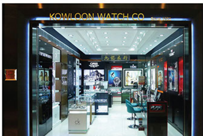
■ 九龍表行上水分店

九龍表行相信中國年青人為將來消費市場主力，此消費群受良好教育，亦懂得生活品味。為了迎合此市場需要，我們聘請具良好普通話水平的年青員工，並引入年青時尚品牌如CK、Emperor Armani、Gucci等，投入大量資源在店舖裝修，把店舖打造成時尚專門店，希望九龍表行成為他們的首選。