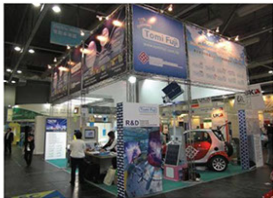
■ 富藤參加香港環保展2011情況

與種植及休閒活動，陶冶性情，減輕工作壓力。另外鼓勵員工參與工作相關進修課程，提高水準優化技術，不時邀請商會舉辦專題研討會與員工並肩參與。更每季舉辦不同比賽，提升員工之工作效率及向心力。