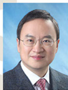
陸地博士 香港工商品牌保護陣綫 創會主席