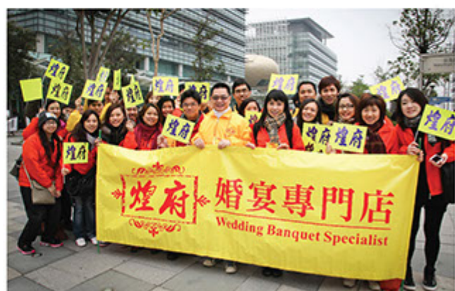
■ 煌府每年會以新人名義捐款及參與「公益金百萬行」