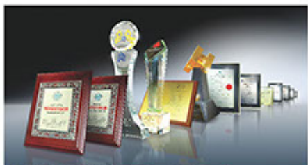
■ 德國寶屢獲中外殊榮、國際肯定