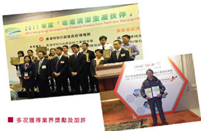
■ 多次獲得業界獎勵及加許