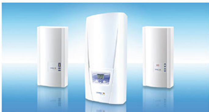
■ 德國寶100%德國原裝進口即熱式電熱水器，環保節能