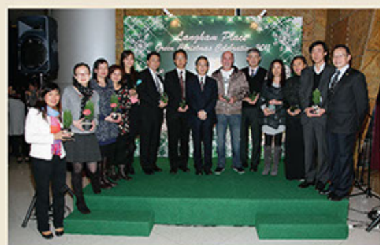
■ 與寫字樓租戶攜手推動綠電及環保活動，共同為保護地球盡一分力

攜手推動紙張、膠樽、廚餘、充電池等回收計劃，為環境作出貢獻。去年聖誕節期間，公司為寫字樓租戶舉辦首屆 Green Christmas Celebration，鼓勵他們繼續支持這項有意義的環保活動。