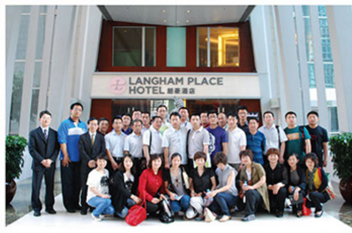
■ 邀請國內的先進企業前來參觀，互相交流切磋，分享經驗