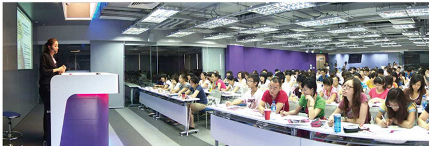
■現代教育提供包括中小學補習服務、英語培訓及應試課程、正規日校課堂、海外升學諮詢及其他海外大學的銜接課程和服務

現代教育成立於1989年，已累積超過20年私立教育服務經驗。旗下品牌包括現代教育、現代小學士、現代書院、現代海外升學及現代教育專業英語中心等；是本港舉足輕重的教育先驅代表之一。